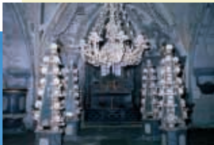
Beederhuis in Kutná Hora-Sedlec

Ook voor de zoekers van curiositeiten en uitzonderlijke zaken kunnen burchten en kastelen de juiste plaatsen zijn. Wie zou nu verwachten dat men op kasteel Lednice, dat op de lijst van de UNESCO staat, de kop van een mammoet tegenkomt? Of