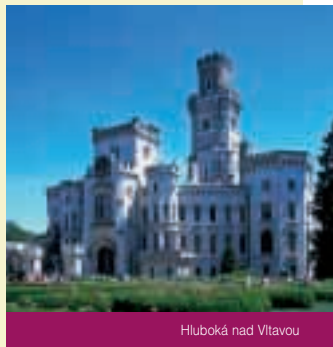
Hluboká nad Vltavou

Voor velen zijn burchten en kastelen allereerst plaatsen van romantiek, dromen en geheimen. Ook kunnen we onder de indruk komen van de overweldigende schoonheid van kastelen met hun prachtige interieurs en goed verzorgde parken (Hluboká, Lednice, Konopiště, Kroměříž) en van de ruwe pracht van de ruïnes van de middeleeuwse burchten, die in de loop der eeuwen door de tijd, branden of vijandige legers geleden hebben (Hukvaldy, Rabí, Točnick, Trosky). Men begint dan te dromen en zich een voorstelling te maken van de bewoners van deze plaatsen in het verre verleden, over hun dagelijkse vreugden en zorgen en ook over de grote dramatiek van hun liefde en haat, die zich tussen de oude muren heeft afgespeeld.