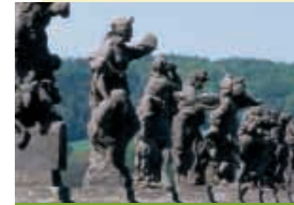
Kuks – beelden van Braun

Weetgierige toeristen kunnen die burchten en kastelen kiezen, waar exposities van museale collecties zijn ingericht (Kámen, Rabí, Kynžvart, Lipnice, Nebílovy, Častolovice, Jánský Vrch, Nové Město nad Metují, Nový Jičín, Strážnice). Diegenen,