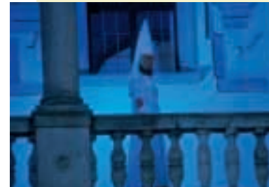
Tijdens een nachtwandeling op de burcht kunt u de Witte Dame ontmoeten

Griezelt U graag? Dan moet U een van de plaatsen bezoeken die omgeven zijn door geheimen en legenden. We hebben voldoende van dit soort plaatsen in voorraad. Ga bijv. naar Sychrov, Zvíkov of naar de burcht Radaně. Volgens vele getuigen spookt het daar ook nu nog. Het