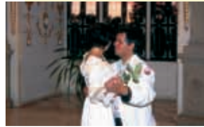
Een bruiloft op een kasteel is ook heden mogelijk

Vele burchten en kastelen bieden geliefden, die hun huwelijksdag op zo'n romantische plaats willen doorbrengen, de mogelijkheid om de bruiloftsceremonie in de zalen van kastelen of de kapellen van de burchten te