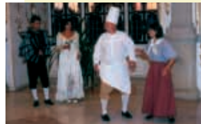
Wilt U dineren op het kasteel?

Ook culinaire liefhebbers hoeven geen angst te hebben voor een bezoek aan de Tsjechische burchten en kastelen. Wanneer U de echte Engelse punch op het kasteel Hrádek u Nechanic niet blijft, kunt U tenminste in Vizovice leren hoe slivovice